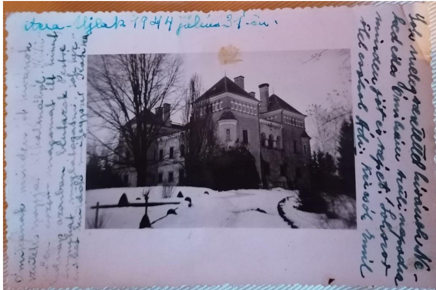
Az Acsaújlaki kastély